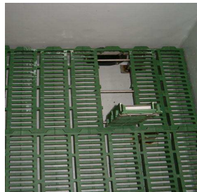
Serviceklappe in MIK-Rost