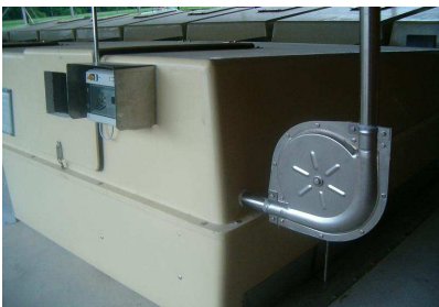
autom. Fütterung möglich