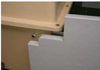
Detail Anpassung Auslauf