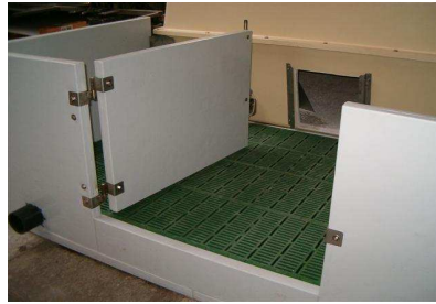
Auslauf CH 2.9 m2 mit Türe und Umrandung und Güllewanne mit 1 Gülleauslauf