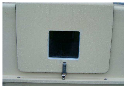
CH-Standard eingebautes Fenster